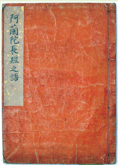
阿蘭陀長短之語 著者・書写年不詳 19世紀初頭か

私たちは外国語を学ぶとき単語を覚えます。実は「単語」は江戸時代にオランダ語のエンケルウォールト(enkel word)の訳語として生まれました。外国語の単語に与えられた訳語の変遷から、私たちは異文化交流の歴史を知ることができます。本展示では、神田佐野文庫から、長崎のオランダ通詞たちの単語帳、蘭書翻訳に従事した蘭学者たちの単語帳や辞書、文明開化期の英単語帳など、関係資料29点を選び、異文化交流の諸相を考察します。