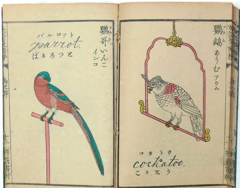
絵入英語箋階梯 鳥之部 安部喜任著 服部雪齋画 慶応3年(1867)8月 特翁書軒蔵