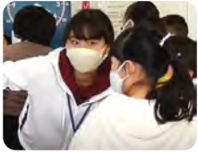
今年度実習生の様子(一部) 於 船橋市内公立小学校

次年度「児童英語教育実習(船橋)」へ参加を希望する現一〜三年生のみなさん、履修相談などはメールで対応中ですので、お気軽にお問い合わせください。(問い合わせ先・・・CTEC 佐々木)