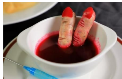
▲ 生き血と指 ビーツのスープ