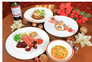
▲クリスマスパブディナープラン