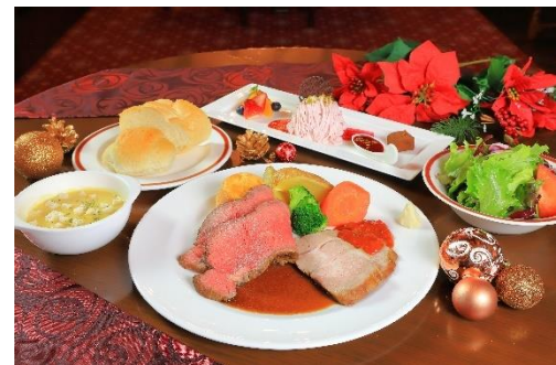
▲パブローストビーフプレート

12月17日(土)～18日(日)、23日(金)～25日(日) ¥2,500/名 英国の街角にあるパブの雰囲気そのままに再現したフォルスタッフパブにて、クリスマス限定「パブローストビーフプレート」をご提供いたします。12月1日(木)からは、クリスマスカクテルも販売。 ※ご予約不可・ご来店順にご案内いたします。