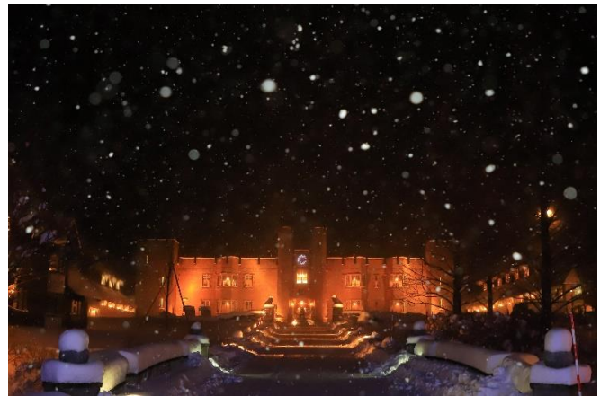
▲雪が降る夜のマナーハウス