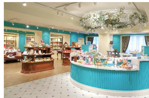
▲ギフトショップ・ビクトリアンアレー

ギフトショップ・ビクトリアンアレーでは、11月12日(日)よりクリスマス商品を数量限定販売いたします。英国雑貨や輸入菓子など、クリスマスモチーフの商品を取りそろえました。冬仕様の装飾が施された店内で、海外気分でのお買い物をお楽しみください。