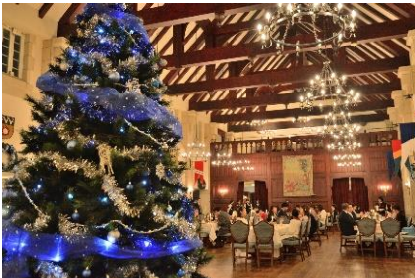
▲ハイランドクリスマスプラン

【クリスマスパブディナープラン】 食事会場:フォルスタッフパブ 英国の街角にあるパブの雰囲気をそのまま感じられるフォルスタッフパブ。暖炉で暖まりながらお食事をお楽しみいただけます。12月1日(木)~25日(日)はクリスマス仕様の特別なディナーをご提供いたします。プラン料金は大人1名あたり24,000円からです。