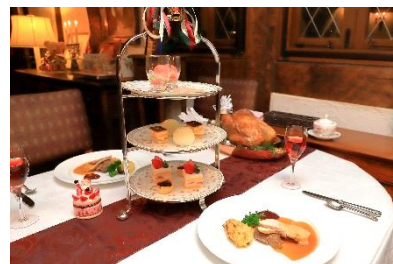
▲クリスマスハイティーディナープラン