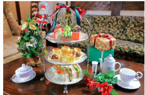
▲クリスマスアフタヌーンティー

12月週末&23日・数量限定販売 ¥3,200/名 毎年好評の「クリスマスアフタヌーンティー」が今年も登場。イギリスのカントリーサイドを思わせる可愛らしいアスコットティールームで、優雅なティータイムをお過ごしください。お持ち帰りのケーキやスコーンもございます。 ※ご予約不可・ご来店順にご案内いたします。