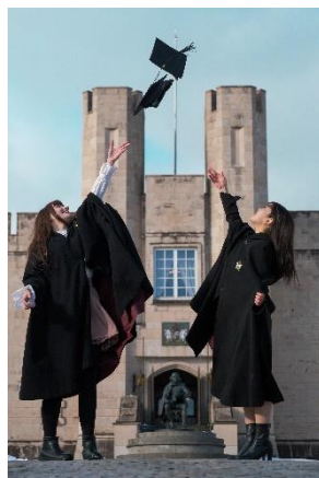
▲ オリジナル卒業証書、卒業帽・マントで写真撮影