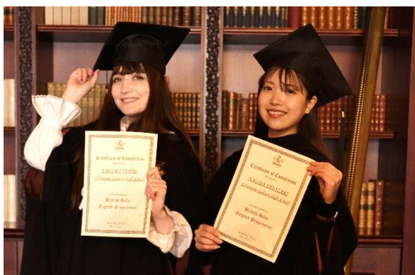
▲ オリジナル卒業証書・卒業帽・マントで写真撮影

【プラン予約】 https://reservation.british-hills.co.jp/asp/489/menu.asp?id=07000028&ty=Lim&plan=56&lan=JPN