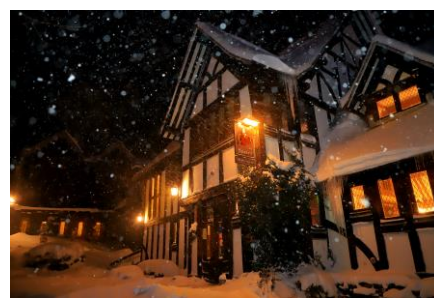
▲ フォルスタッフパブ