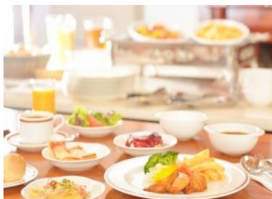
▲ ブッフェブレックファスト

スクランブルエッグやサラダ、パン、ソーセージ、ヨーグルト、フルーツなどさまざまな種類のお食事を用意しております。お好きなメニューをお好きな量でお召し上がりください。感染症拡大予防対策をしながらブッフェスタイルで提供いたします。