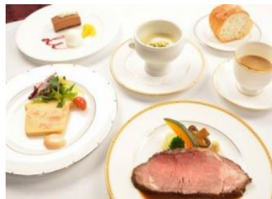
▲ 学生限定コースディナー