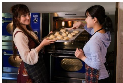
▲ カルチャーレッスン「クッキング・スコーン」