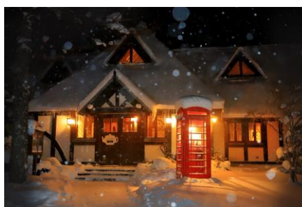
▲ アスコットティールーム