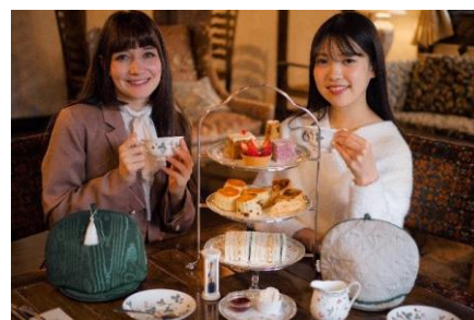
▲ アフタヌーンティー