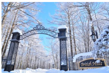
▲ ブリティッシュヒルズの正門

まるで海外にいるかのようなフォトジェニックな空間で、思い出の1ページを提供いたします。