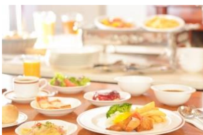
▲ブッフェブレイクファスト

スクランブルエッグやサラダ、パン、ソーセージ、ヨーグルト、フルーツなどさまざまな種類のお食事を用意しております。好きなメニューをお好きな量でお召し上がりください。感染症拡大予防対策を施しながら、ブッフェスタイルで提供いたします。