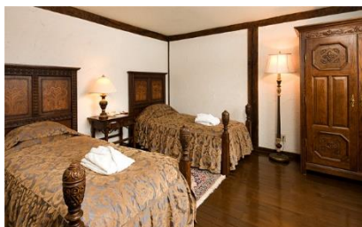
▲スタンダードルーム

木造と漆喰を基調とした安らぎの空間。英国伝統様式のバスルーム(クラシックな猫脚のバスタブ)、凝った装飾の洗面台をご用意しております。中世英国の優雅な雰囲気の中で、ゆったりとした時間をお楽しみいただけます。