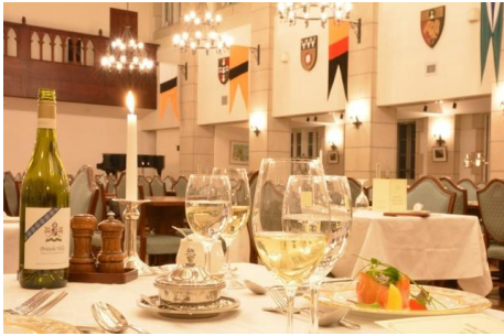
▲ リフェクトリー会場/GW限定スペシャルディナー

今年のご夕食を2会場(リフェクトリー/フォルスタッフパブ)から選べ、リフェクトリー会場ではアンガスビーフのローストを中心とした「GW限定スペシャルディナー」、フォルスタッフパブ会場では牛ロースカットステーキを中心とした「シーズナルディナー」をご提供。ご朝食は、リフェクトリーにてbuffetスタイルのお食事になります。