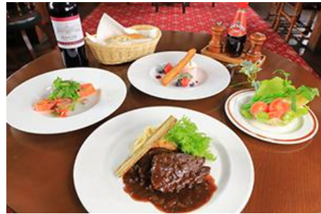
▲ フォルスタッフパブ会場/シーズナルディナー