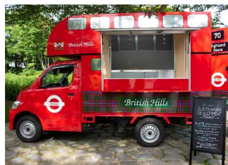
▲ ブリティッシュヒルズのキッチンカー「ハイランドオアシス」

ブリティッシュヒルズのキッチンカー「ハイランドオアシス」では、地産地消の観点から天栄村のお米を使用したビーフカレーをご提供いたします。その他、天栄村の地元食材を使用したホットサンドが楽しめる「もみじカフェ」、英連邦の国ジャマイカの料理が楽しめる「Irie Wood NINE MILE」が出店予定です。