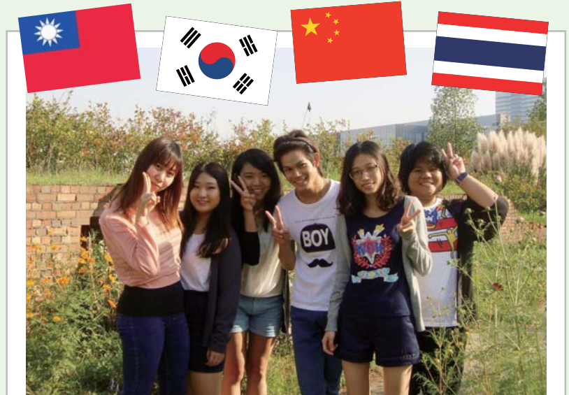
留学生別科「日本語インターアクション5」のみなさん。出身は中国、台湾、韓国、タイ

みなさんは外国語を学んでいて、どんな時に楽しいと感じますか。勉強が辛い時はどうしていますか。みなさんの将来に勉強した外国語は関係しそうですか。「留学生と語る! ウィーク」の第二弾は、留学生と学部生が外国語学習や留学を通して感じたことについて話します。